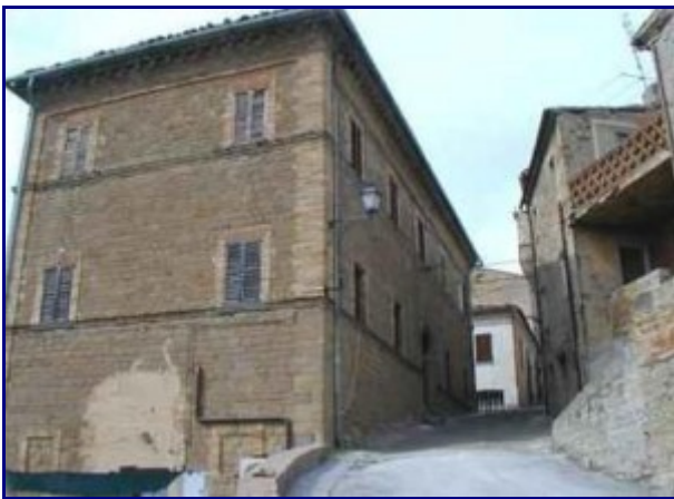
Scorci di Nidastore - Foto di arceviaweb.it

Tale costruzione sorge su un poggio a 300 mt di altezza ed è uno dei più antichi della zona. Edificato intorno all'anno 1072 è stato poi rimaneggiato e ampliato tra la fine del 1300 e gli inizi del 1400. La cinta muraria è interamente percorribile ed è considerato un esempio di architettura militare della provincia di Ancona.