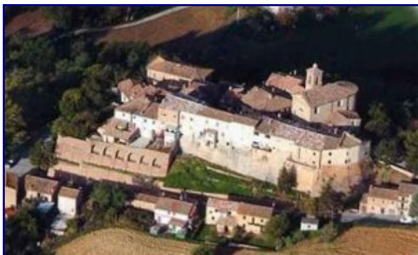
Castello di Nidastore

Nidastore è un borgo di Arcevia in provincia di Ancona . Il nome Nidastore significa Nido degli Astori cioè dei falchi che nel Medioevo venivano addestrati alla caccia.